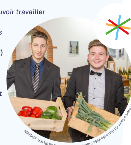
Drive fermier, Lycée Jacques Prévert à Saint-Christol-lez-Alès (Gard)

Isabelle, principale d'un collège (Direction, mars 2018)