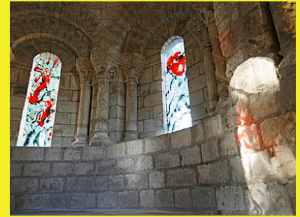
Les vitraux de Zao Wou Ki, réfectoire du Prieuré de St Cosme Site internet : https://www.prieure-ronsard.fr/explorer/creation-contemporaine/