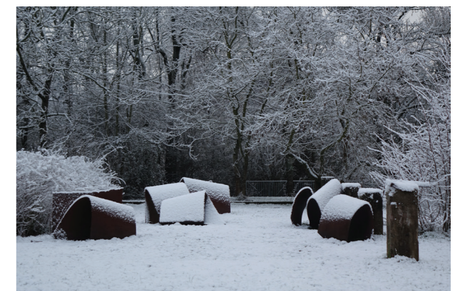
Photographie d'une sculpture du Parc prise pendant l'hiver, sous la neige. Renouées , Pierre Tual