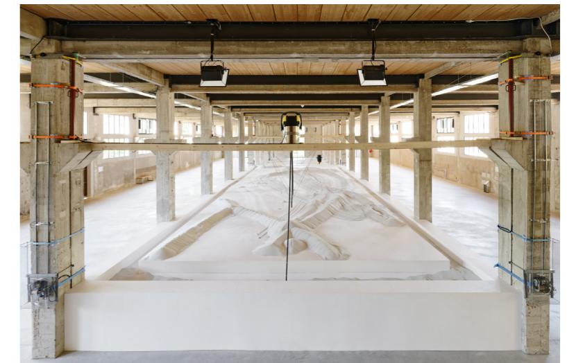
La Grande Halle est constituée de hautes fenêtres ouvertes sur l'extérieur, qui laissent entrer la lumière, accentuant l'impression de clareté et de luminosité pour cette installation. Les larmes du prince - Vitriification , Anne-Vamérie Gasc