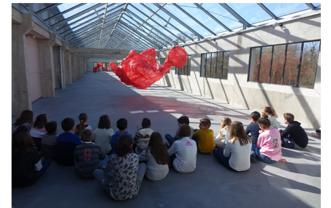
Vue du même espace d'exposition lorsque le temps est ensoleillé. Principe d'incertitude , Tatiana Wolska