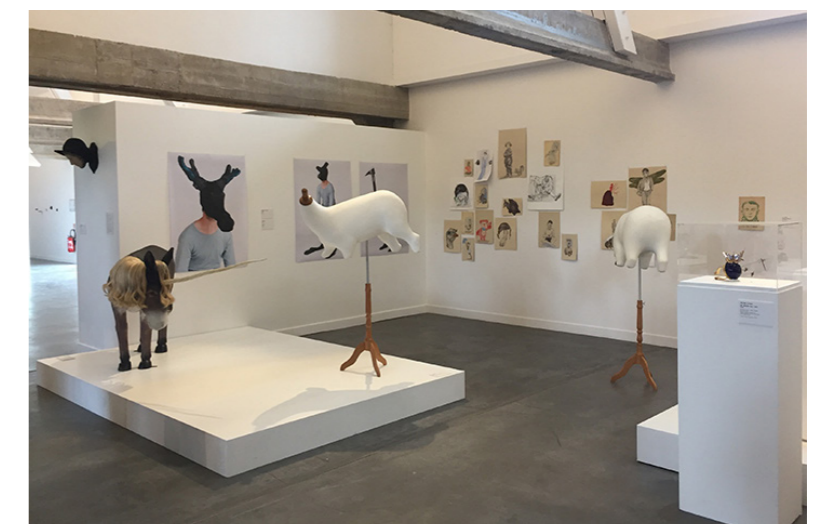
L'éclairage ici est dirigé méthodiquement pour créer une scénographie adaptée à l'exposition et mettre en valeur les pièces artistiques. Formes d'histoires , Eric Dégoutte