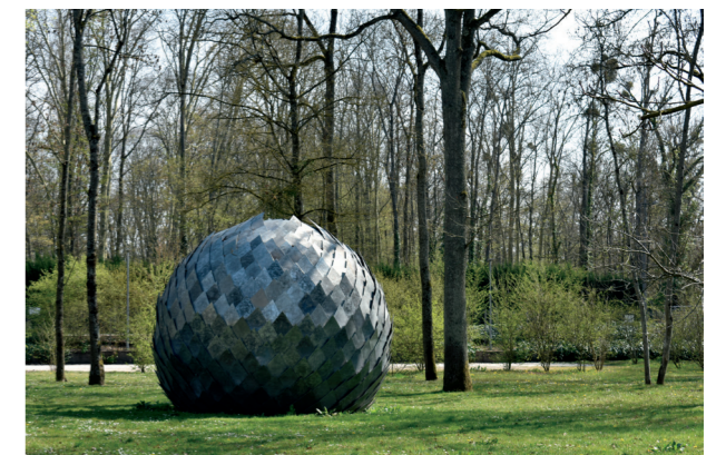
Photographie d'une sculpture du Parc des Tanneries prise au printemps. Una misteriosa Bola , Antoine Dorotte