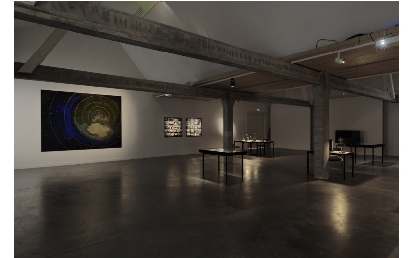
La Galerie haute plongée dans la pénombre pour une de ses expositions. The Great Offshore , Eric Baudart

> Liens possibles avec nos espaces d'exposition tout au long de l'année.