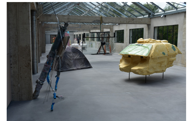
Vue de l'espace de la Verrière soumis aux intempéries et plongé dans la pénombre The Midnight Sun , Eric Baudart

> Visite-atelier autour du Parc des Sculptures, avec la possibilité de visiter le site à plusieurs périodes, pendant des saisons différentes.