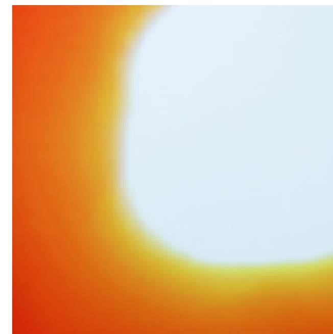
Vue de l'exposition époque (ici) , Virginie Yassef Courtesy Les Tanneries - CAC, Amilly